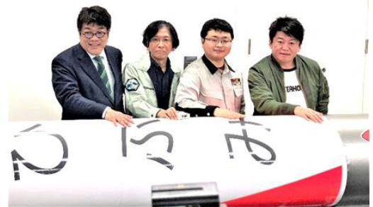
東京で開催された「MOMO 2号機」打ち上げ発表会