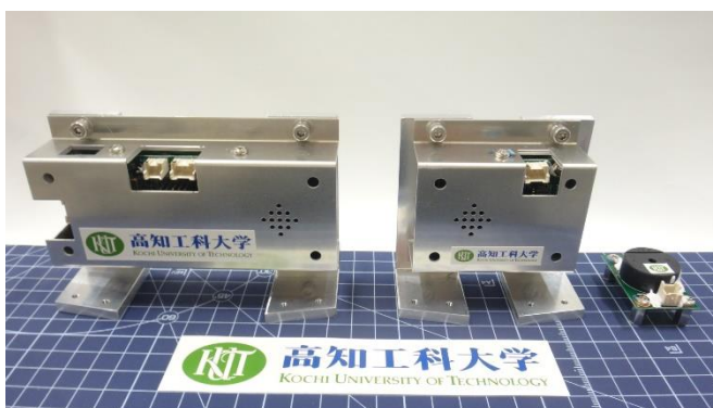
観測ロケット先端部に搭載するインフラサウンド計測機器 左から、メインマイク、サブマイク、ブザー

音は遠い距離まで伝わる場合には、上空の成層圏まで行って帰ってくるモードもあり、どの位のエネルギーがそこまで行っているかは殆ど実測されておらず未解明です。ノイズの少ない高層大気中で実験を重ね、少しずつデータを蓄積していく必要があり、今後も同社と継続的にコラボし実験を重ねていく予定です。