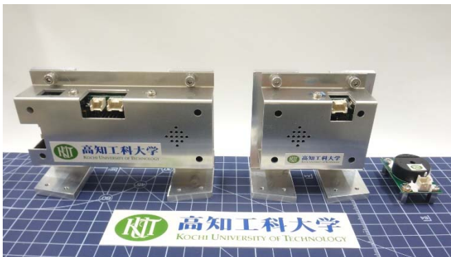
観測ロケット先端部に搭載するインフラサウンド計測機器 左から、メインマイク、サブマイク、ブザー

音は遠い距離まで伝わる場合には、上空の成層圏まで行って帰ってくるモードもあり、どの位のエネルギーがそこまで行っているかは殆ど実測されておらず未解明です。ノイズの少ない高層大気中で実験を重ね、少しずつデータを蓄積していく必要があり、今後も同社と継続的にコラボし実験を重ねていく予定です。