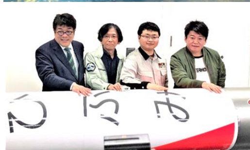
東京で開催された「MOMO 2号機」打ち上げ発表会