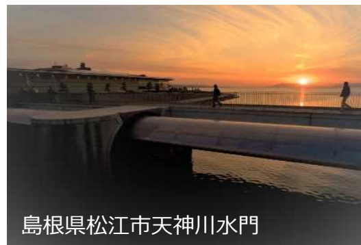
島根県松江市天神川水門

会場の地域・文化交流施設「Cross Square(クロススクエア)」は、本学ならびに本学学生及び教職員と地域住民との交流を目的として、香美市の中心部、JR土佐山田駅から徒歩5分、香美市役所近くの便利の良い場所に開設した施設です。