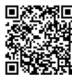
香美市チャットボット

住民対応の迅速化と住民サービス向上を図るため、 24時間・365日 住民からの質問に対して、 AIが自動応答 をして、自治体職員の業務の効率化と住民の利便性の向上を図ります。また、移住・定住希望者からの問い合わせにも対応。