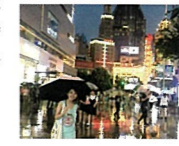
グローバルな活動が評価されて、名譽あるKUT Youth Ambassadorに任命されました。

もともとは英語の教員志望だったので、大学のグローバルプログラムで、英語研修などに参加していました。それが3年次に中国の黒龍江大学へ約半年の留学をすることに。英語圏でなく中国にした理由は、今までそこにKUTから誰も留学したことがなかったというチャレンジ精神。たった一人で乗り込み、英語で経済を学びつつ、全く初めての中国語での生活を始めました。当初は途方にくれることも多かったのですが、4カ月で中級レベルの授業についていけるようになりました。おかげで中国でのAIやネット産業の発展を間近に体験でき、ビジネスに強い興味を持ってたも留学の成果。将来の進路の幅が大きく広がりました。