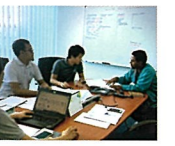
日本人が移住したい国アンケートで、No.1になるマレーシア。インターンシップ期間はホテル住まいでしたが全く安全でした。

海外で仕事がしたいという憧れと、建築物に興味があり、1年次の頃からヨーロッパの国々を訪れていました。歴史ある美しい建物に感銘を受けましたが、それはすでに出来上がったまちを保存することが主となっているようにも感じました。その逆が海外インターンシップで訪問したマレーシア・クアラ Lumpur。急速な発展を遂げている真っ最中の街には活気が溢れ、この熱気に参加したいと思いました。建築設備関係の日系企業でのインターンシップでは、部材の構造計算を依頼され、大学で学んだ知識を生かすことができました。コンクリートの研究という専門分野をより深く極め、防災や街づくりに取り組んでいきたいと思っています。