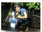
普段はタイのプラバラー大学で学び、マングローブ林に設置したセンサーから送られてくるデータをチェックしていました。

地表面から地上1.5mくらいまでの地表面の状態によって、著しい影響を受ける気象を「微気象」といって植物の生育に大きな影響を与えます。IoTを使って微気象を計測し、より良い植物の生育環境を探ろうと、自作のセンサーによるタイのマングローブ林の調査を立案し、『トビタテ! 留学JAPAN』(中面参照)の理系・複合・融合系人材コースに応募し採用されました。ヒルギモドキというマングローブの一種には、血圧降下や抗がん剤の有効成分とみられる薬理作用が含まれています。ヒルギモドキが効率的に育つ環境を解明し、整備することが今後の研究の支えになると考えたのです。今回のタイでの5カ月間の留学体験を手始めに、最終的には薬理成分の製品化をめざし研究を続けていきたいと思っています。