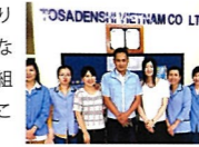
ベトナムでのインターンシップでの経験を卒業研究テーマに発展させました。

大学2年次のタイ・シンガポール研修で、海外の学生たちの学ぶことへの意欲の高さや英語から日本語まで流暢に操る語学力に、焦燥感を抱き、そのことが学びの原動力になりました。語学力をつけることを目標に、様々な英語教材を駆使して学びつつ海外へ行ける機会を探しました。3年次にアメリカ ミズーリ州の大学に短期留学、帰国1週間後にベトナムの日本企業でインターンシップに参加。その後3年次3月から6カ月間、ドイツ・ダイムラーグループの一員の三菱ふそうトラック・バス株式会社でインターンシップに参加しました。海外営業本部でインボイス(送り状)の作成や販売計画の提案など、日々の作業も熱心に取り組み、おかげで就職に結びつけることができました。