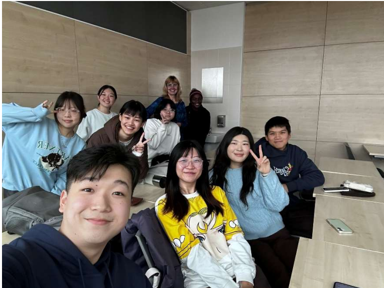
↑チェコ語クラス最後の授業の日

この授業はチェコ語を実践的に学ぶ授業です。内容自体はそこまで難しくはないですが、会話の練習を通じて学びます。チェコ語は名詞や形容詞の形が男性に使うのか、女性に使うのかなどで多様に変化するので日頃から復習することをお勧めします。授業の雰囲気はとても明るく楽しかったので1週間の授業の中でも1番楽しみな授業でした。