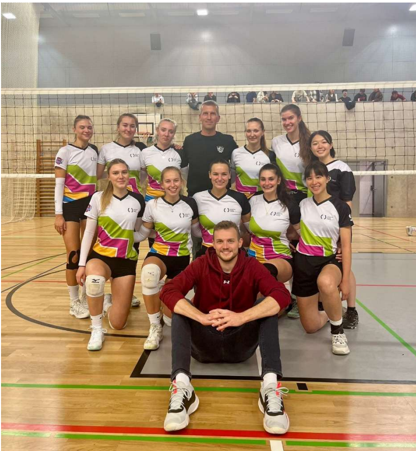
↑ UHK の女子バレーボール部

エラスムスがボランティアで提供している ESN ではパーティやハイキング、レーザーシューティングなどの活動に参加できます。交流の幅も広がるので、何かコミュニティに参加したい場合、ESN のアクティビティに参加してもいいと思います。