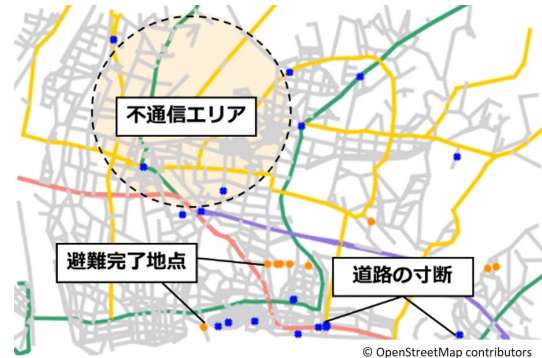
図1 シミュレーションマップ例

無線通信が可能な範囲にいる車同士で情報の送受信を行う。これまでに蓄積した道路情報を相手に伝えることができる。