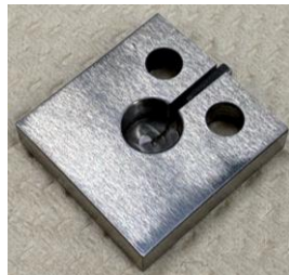
図2 使用したサンプル表面 図3 使用したサンプル裏面

実験で用いた装置を図1に示す。実験では、水素を流入させ、グロー放電を行い、サンプルの脆化を観察した。また、実験で用いたサンプルの表面は図2に、裏面は図3に示す。サンプルは、1辺20mm、厚さ5mmの正方形の中央に浅いくぼみがあり、側面から細いスリットを導入した金属板を用いた。グロー放電を行う時間を変化させ、時間ごとのクラックの進展を観察した。