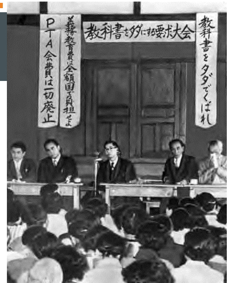
高知市立南海中学校

総務省 https://www.soumu.go.jp/senkyo/senkyo_s/data/index.html